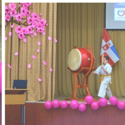
- Выступление младшей группы воспитанников Спортивно-образовательного центра «Киокушинкай», г.Пермь (учащиеся младших классов МАОУ «СОШ № 32 им. Г.А. Сборщикова»)